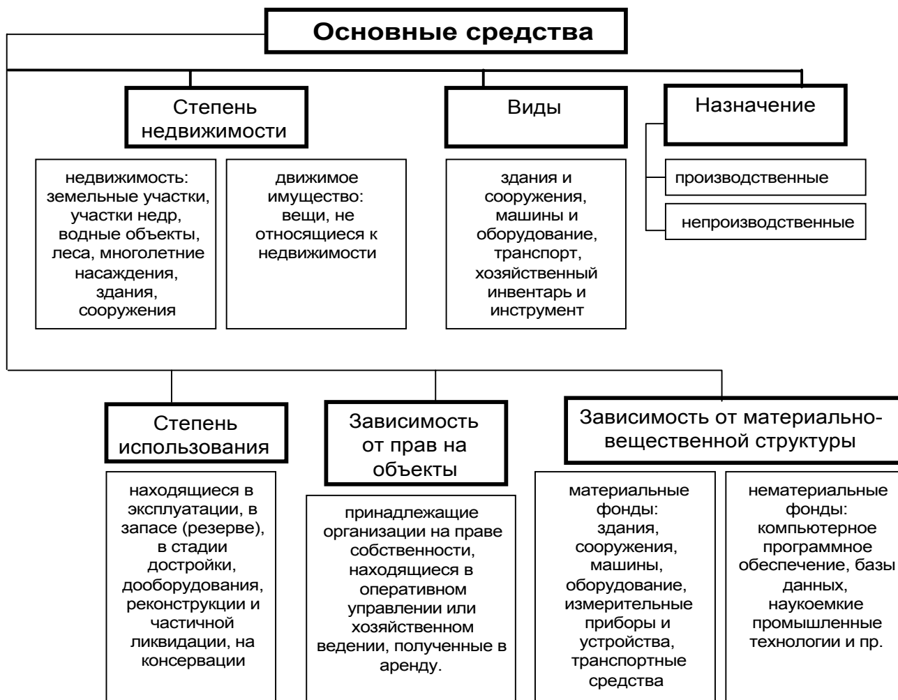
Рис. 1. Классификация основных средств